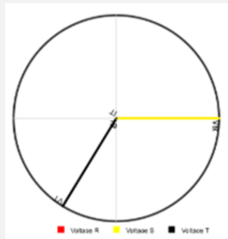
Gambar 2. Diagram Phasor Tegangan Saat Gangguan